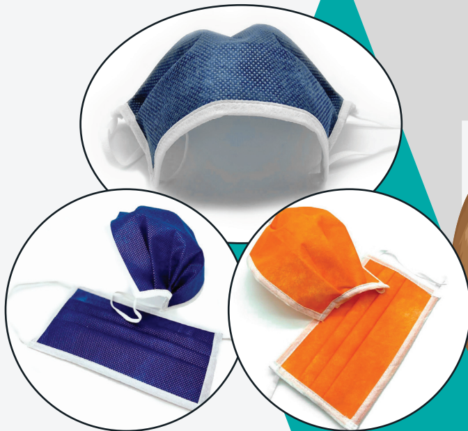
DOS COLORES DISPONIBLES

(VVPDVFULOOD FRSOFRDD QUPDWV GBEYGLH OLQVWLRGH GXVLD RPHFLR XULVPR 6 H UNUD HUDO GHLGXVLD GHDD SHXO \PGLDD IPSUVD FRPRO$8, // $, *e1, $SU HVHDD FDSDFLGDG GHLOWDFLYGHFUJDEDFWLD HFXDOND XDPDVFULOOD GHDFWRUD )3